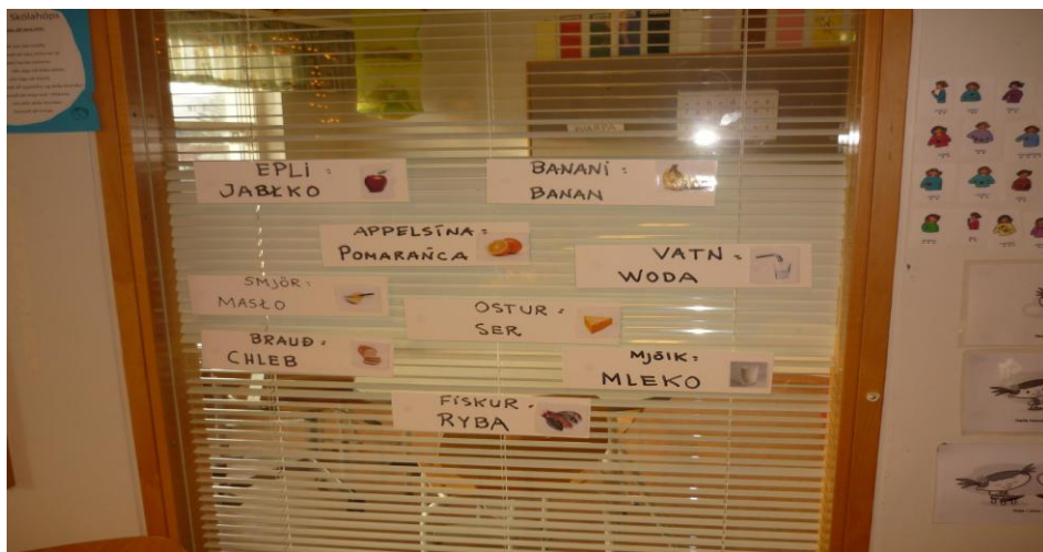
Ritmál barna af erlendum uppruna gert sýnilegt á deild.