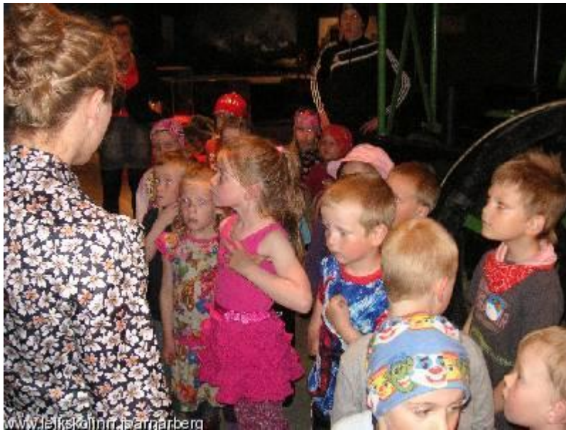
Frétt af heimasíðu leikskólans 21. júní 2011

Við lögðum af stað rúmlega 9 í frábæru veðri með þunga bakpoka fulla af mat. Komum í Árbæjarsafn um kl 10:30 og fengum leiðsögn um safnið. Við skoðuðum gömul hús og gamla hluti sem börnin stundum þekktu ekki. Við sáum lömb, hænur, útikamar, gamla búð, verkstæði, slökkviliðsbíl og kolalest. Við enduðum svo á leikfangasafninu þar sem allir fengu að leika sér. Yndislegur dagur í sól og blíðu og gaman að segja frá því en stúlkan sem fylgdi okkur í gegnum safnið hafði orð á því að sjaldan eða aldrei hefði hún hitt svona flotta krakka sem kynnu að hlusta og væru svo áhugasöm. Húrra fyrir okkur !!