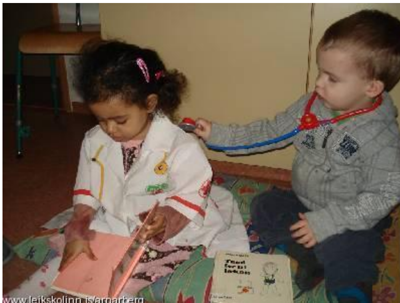
Börn af yngstu deildinni í læknisleik og ekki skemmir það fyrir að lesa sér til um efnið samhliða.